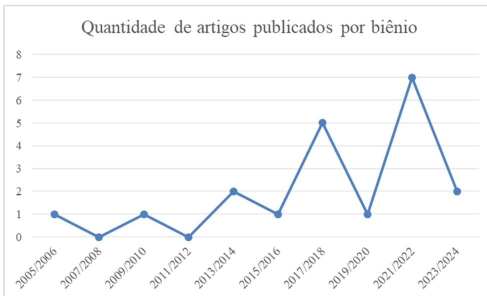
Figura 3 – Quantidade dos artigos revisados publicados por biênio